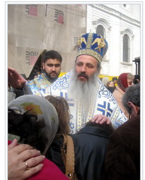
Mitropolitul Teofan binecuvântând credincioșii prezenți în fața Catedralei Mitropolitane de Iași.

În același timp, de doi ani de zile încearcă fără succes evacuarea singurului preot din Mitropolia Moldovei și din țară care, după ce a întrerupt pomenirea mitropolitului ecumenist, a reușit să își păstreze parohia, bucurându-se de un puternic sprijin din partea poporului credincios din localitate.